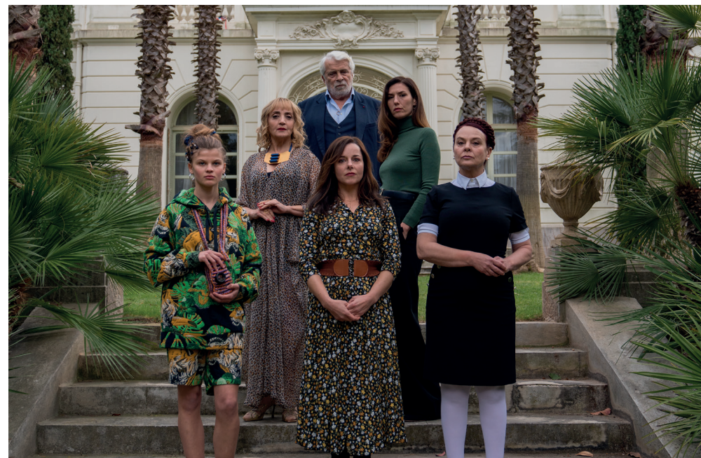
L'Origine du mal | Sébastien Marnier

Juste sous vos yeux 140km à l'ouest du paradis Le tigre qui s'invita pour le thé Sans filtre Ciné-sandwich - Les Expressifs Jack's Ride Les Secrets de mon père Les Jeunes Loups