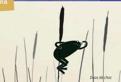
Duos de choc