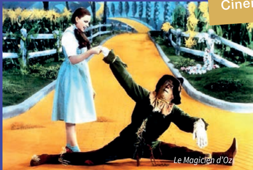
Le Magicien d'Oz