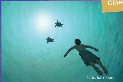
La Tortue rouge