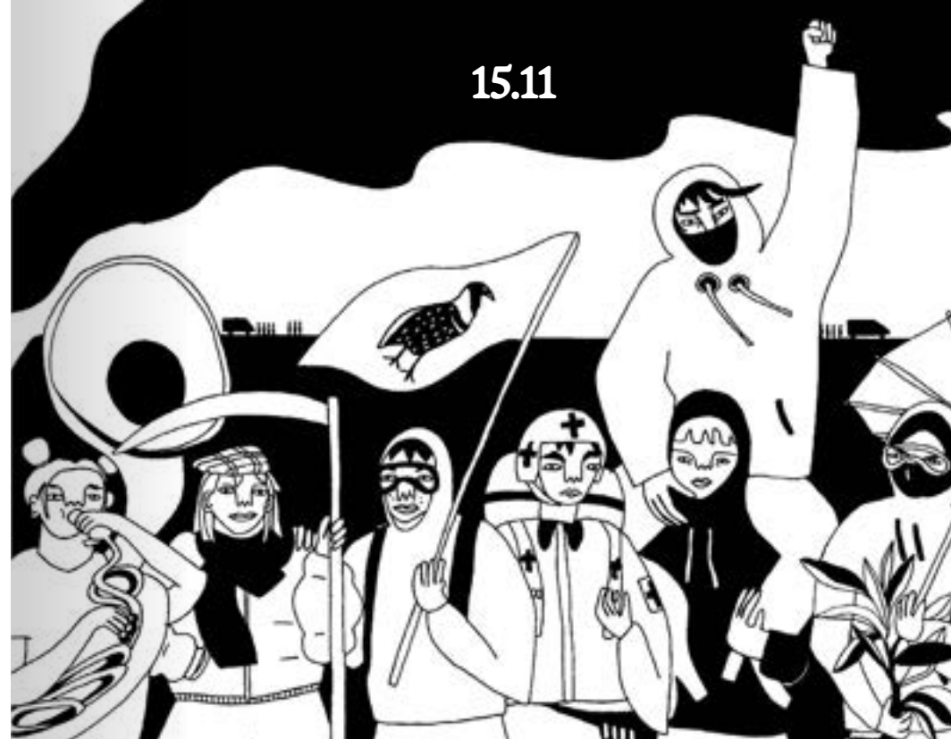
Avoir 20 ans à Sainte-Soline